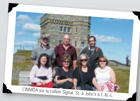
L'INMOA sur la colline Signal, St. à John's à T.-N.-L.

gouvernement de la Colombie-Britannique, a accepté le poste de vice-président. Un nouveau modèle de nomination des dirigeants a été adopté. Le mandat dans chacun des postes de vice-président, président et président sortant sera de deux ans et une même personne passera d'un poste à l'autre afin que le leadership et le partage de la charge de travail soient constants.